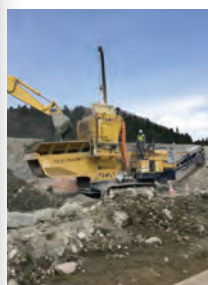
汚泥の混合土質改良