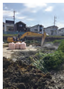
沼地の地盤改良固化